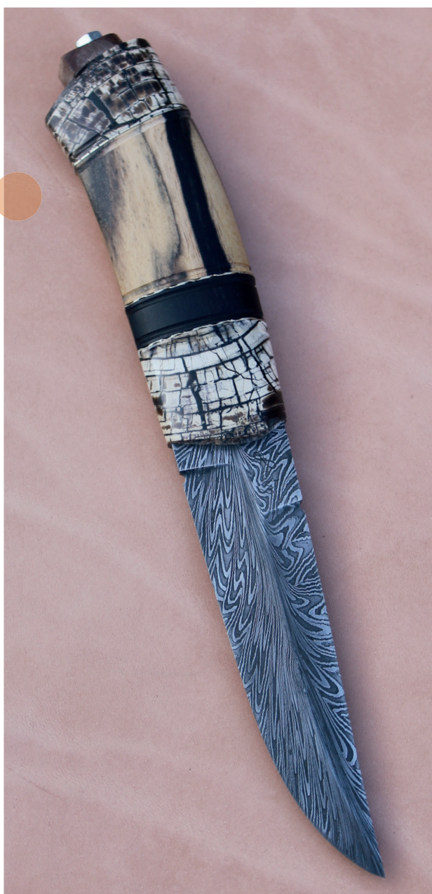
Kniven fra tegningen - hvid ibenholt, mammut, sort ibenholt nysølv med filninger

Det slidte stempel er tydeligvis brugt rigtig mange gange. Det er i øvrigt lavet af en gravør ved det norske hof.