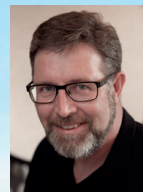
Tekst og foto: Carsten Kümler